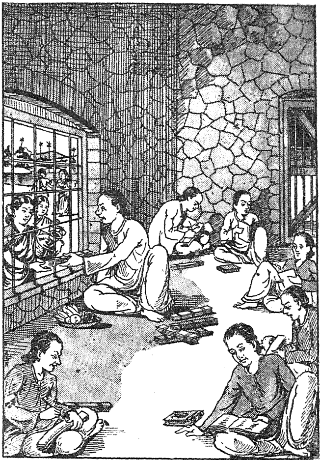
புகழேந்தியார் மாதர்களிடமிருந்து உதவி பெறுதல்