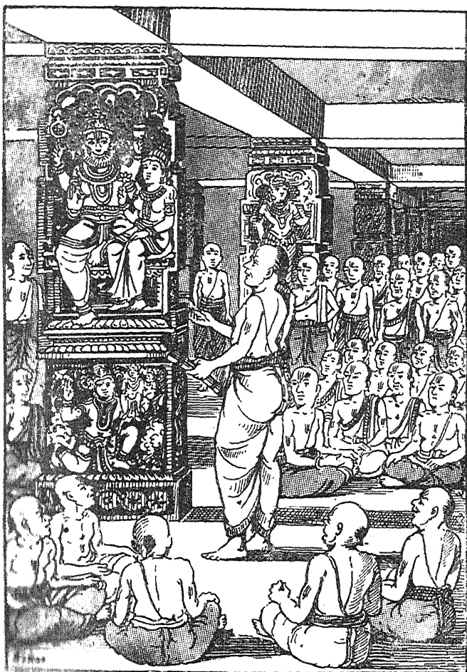
சும்ப ராமாயண அரங்கேற்றம்