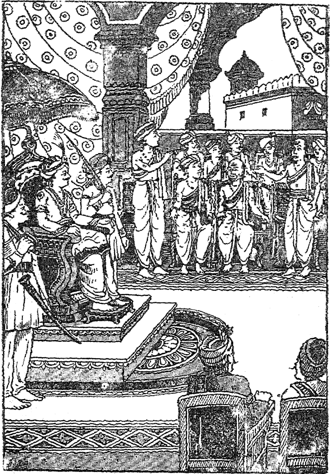
பாண்டியன் அரச சபை