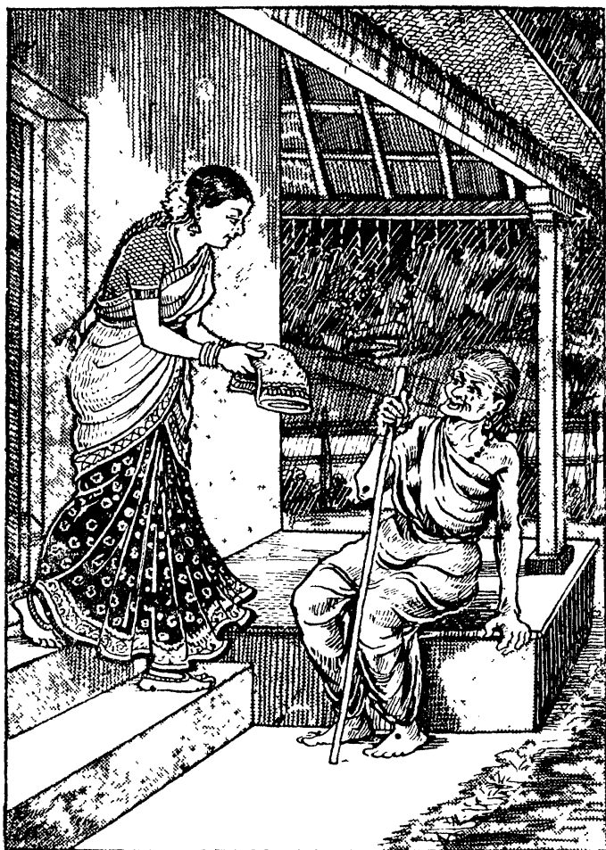
ஒளவையார் நீலச் சிற்றூடை பெறுதல்