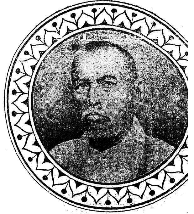
சதாவதானி கா. ப. சிசய்குதம்பிப் பாவலர்