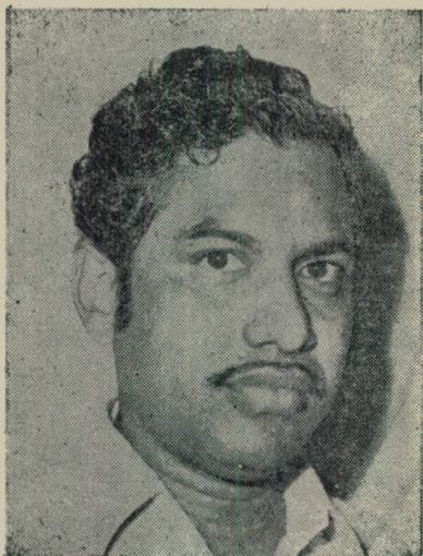
கவிஞர். நா. காமராசன்