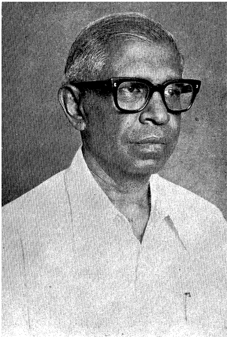
பாவலர் நாரா நாச்சியப்பன்