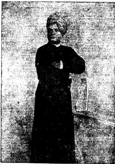
ஸ்ரீ விவேகானந்த சுவாமிகள்.