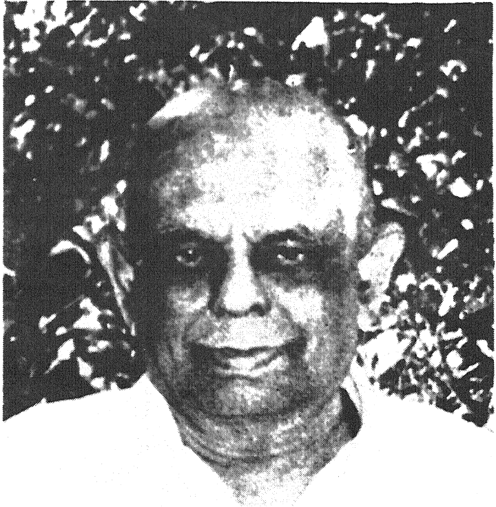
தமிழ்க் கடல் இராய. சொ.