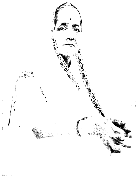
ஸ்ரீமதி கஸ்தூரிபாய் அம்மையார்