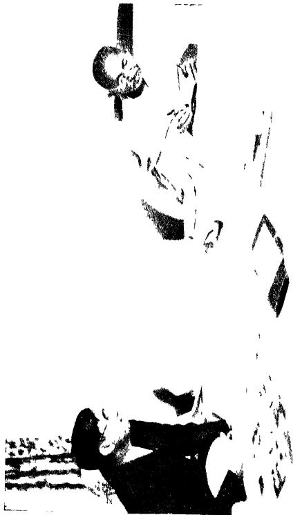
புதிதான ம. காமதேவசாஸ்திரம்