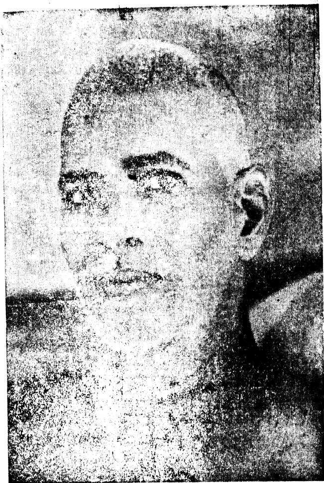
ஸ்ரீ ரமணமஹரிஷிகள் 1879 — 1950