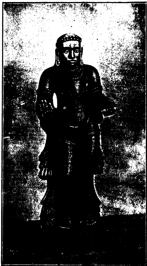
மாதவச் சிவஞான யோகிகள்